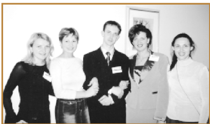
Сотрудники Общественного фонда «Саратовская губерния»

Фонд вправе оказывать финансовую поддержку только в рамках конкурса для реализации проектов, не предполагающих осуществление предпринимательской деятельности или оказание помощи ком-