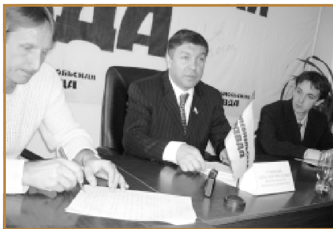
Пресс-конференция об итогах первого областного конкурса социальных и культурных проектов 26 сентября 2003 года

В 2003 году фондом выпущено 2 номера бюллетеня (тираж 500 экземпляров).